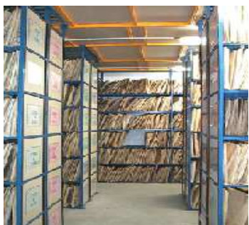
Le CH de Cornouaille conserve et gère plusieurs centaines de milliers de dossiers médicaux

Les informations formalisées sont des informations conservées sur un support (écrit, enregistrement, radiographie,...).